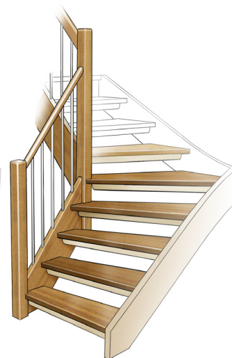
Sara 4.15.6 (Baseline E6)

ST 4 80x80 RS 15 Ø 15 mm rostfri HL 1 40x86