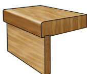
Sättsteg (vid tät trappa)