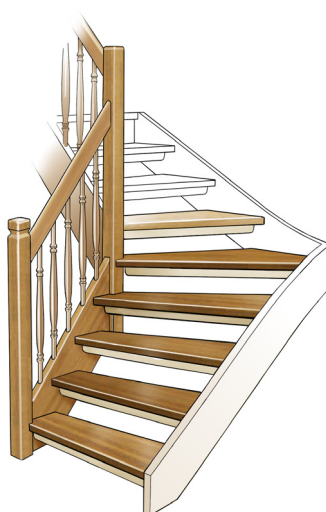
Sara 8.3.1 (Innline 3)

ST 4 80x80 Glas 8 mm härdad/laminerat HL 1 40x86 mm