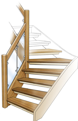
Sara 4.G.1 (Baseline G)

ST 4 80x80 RS 15 Ø 15 mm rostfri HL 6 50 mm