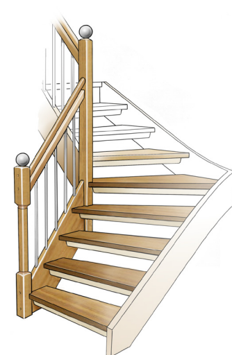
Sara 15.15.12 (Twinline 15)