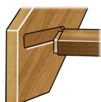
Steginfästning med tapp